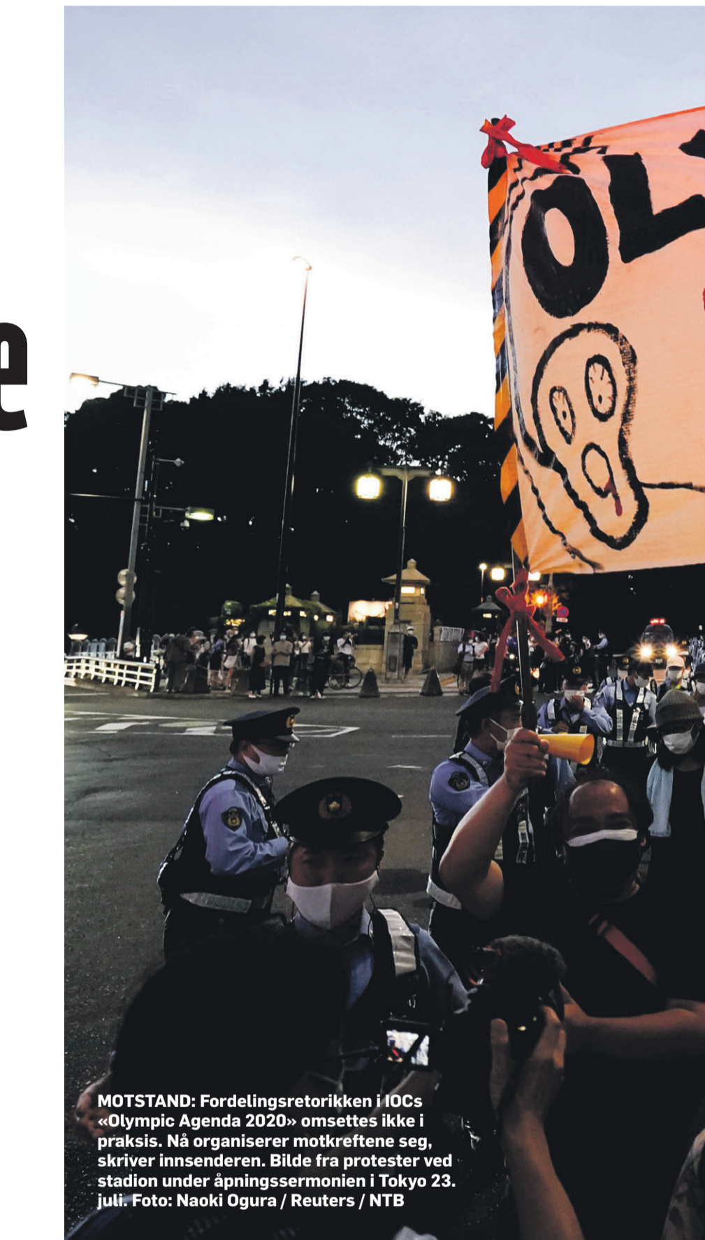
MOTSTAND: Fordelingsretorikken i IOCs «Olympic Agenda 2020» omsettes ikke i praksis. Nå organiserer motkreftene seg, skriver innsenderen. Bilde fra protester ved stadion under åpningssermonien i Tokyo 23. juli.

KOMMERSIALISERINGEN av OL skjøt fart med Los Angeles i 1984. Ordfører Tom Bradley ønsket ikke å bruke offentlige midler på eventet. Men idrettsinvestoren Peter Ueberroth så anledningen til å vise